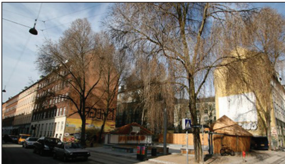
Multipladsen på hjørnet af Ravnsborggade og Skt. Hans Gade, foto: Christian Bang.

nu også kommet trendy tøjbutikker. Og udbuddet tæller også frisør, indisk brugskunst og andre specialbutikker. Men ingen shoppinggade uden hyggelige og imødekommende caféer og restauranter, og det har Ravnsborggade selvfølgelig også. Bevæger man sig videre ned i Ryesgade, finder man desuden gadens eget bryghus, Nørrebro Bryghus.