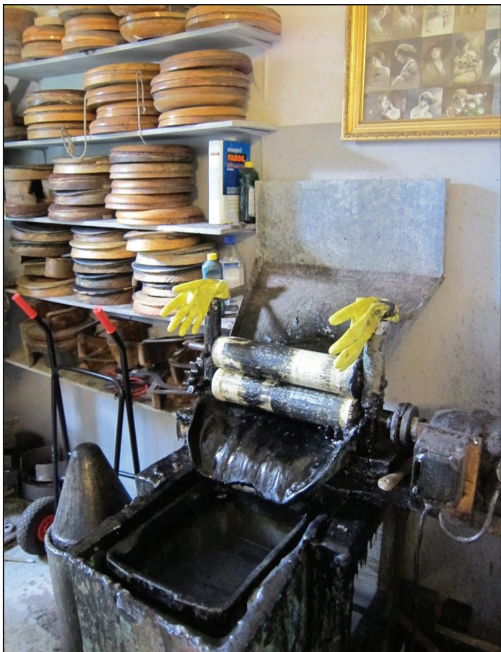
Et lakerings-kar til at give hattene en omgang lak.