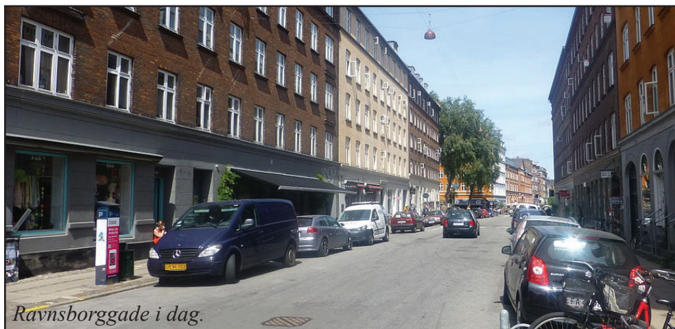
Ravnsborggade i dag.

I dag er Ravnsborggade ved at skifte karakter. Fra at være en næsten udelukkende marskandiser- og antikvitetsgade, er den fra omkring 2010 blevet en blanding af mange slags butikker og en inspirerende shoppinggade. Antikvitetshandlerne er dog stadig til stede i gaden og man kan stadig gå på opdagelse i deres skatte, som også breder sig i kældre og baggårde. I sommerhalvåret og til jul er der desuden loppemarkeder i Ravnsborggade, hvor både private og lokale handlende sælger ud af nyt og gammelt. Men ind imellem antikviteterne er der