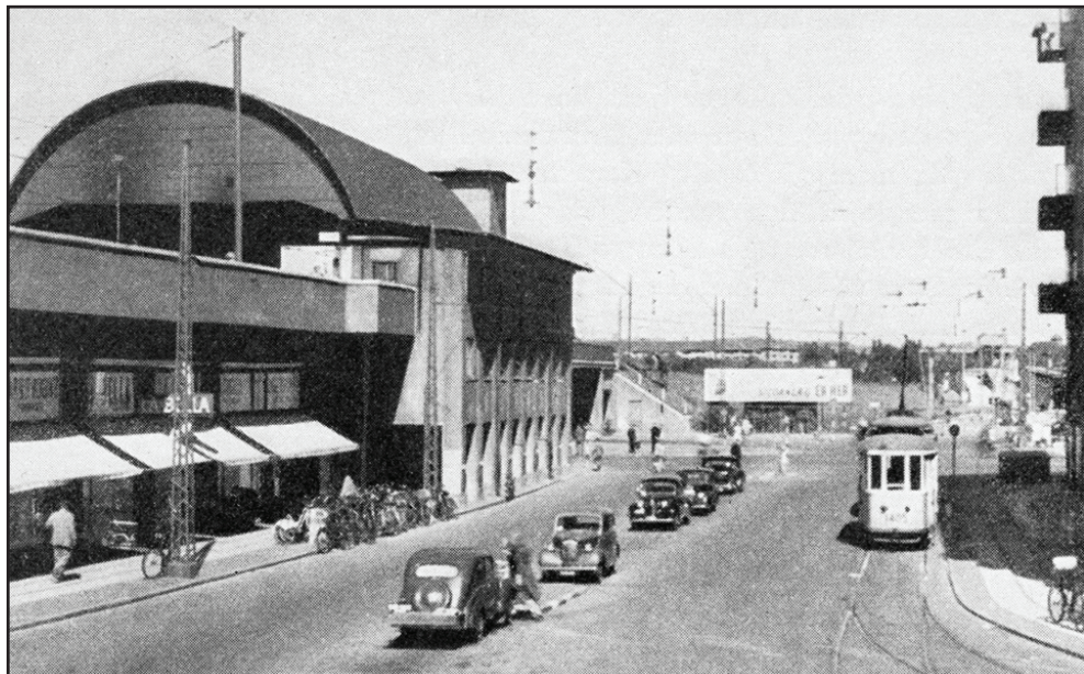
Nørrebro Station og Lundtoftegade (i dag Folmer Bendtsens Plads) set mod Nørrebrogade, ca. 1950.

Under banen hen mod stationen lå først Eva-klubben, en natklub, hvor det af og til gik meget livligt til. I et billigt spisehus, som var godt besøgt, kunne man købe middagsmad til at tage med hjem, - man skulle bare have en skål eller to med. Boller i karry og ris var en af retterne. Jeg husker også La Bella, en isenkræmmer, der solgte meget forskelligt fra cykler til porcelæn og lampekærme. Resten husker jeg ikke, kun at der på et tidspunkt åbnede en mindre forretning med kuglelejer, SKF. Længst henne lå stationsområdet med ”afgangshal”, toiletter, billetkontor og – midt på den store trappe – det lille