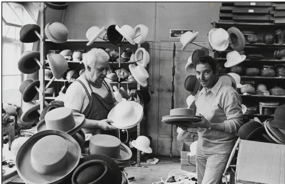
Hattefabrikken for en generation siden.