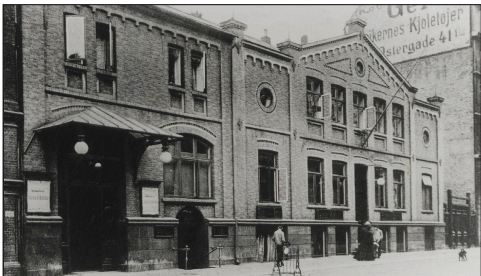
Nørrebro Teater i sin oprindelige skikkelse. Teatret brændte i 1931, men blev hurtigt genopført. Postkortfoto ca. 1910.

var fribolig for personer, der var eller havde været medlemmer af foreningen. ”Den bestandig borgerlige Forening” havde købt Store Ravnsborg på et heldigt tidspunkt og kunne i 1880’erne sælge ejendommen med god fortjeneste. De følgende år udstykkedes den store have og hele det tæt bebyggede kvarter, vi kender i dag, opstod. På en del af grunden opførtes i 1897 en stor boligejendom, der kaldtes Store Ravnsborg, efter det gamle landsted.