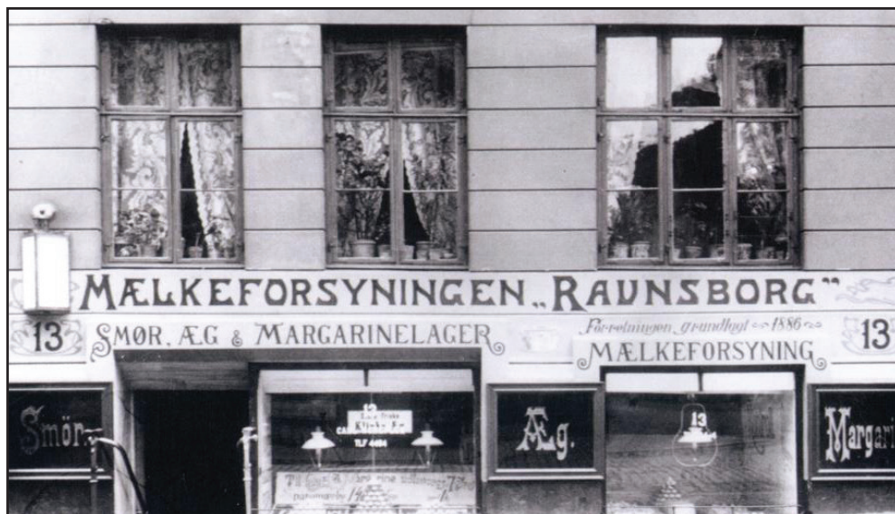
Mælkeforsyningen Ravnsborg, oprettet i 1886 i Ravnsborggade, var forløberen for vore dages Irma-forretninger.

Trods den udbredte nød og fattigdom, der i 1880'erne fandtes blandt brokvarterernes arbejderbefolkning, var der dog