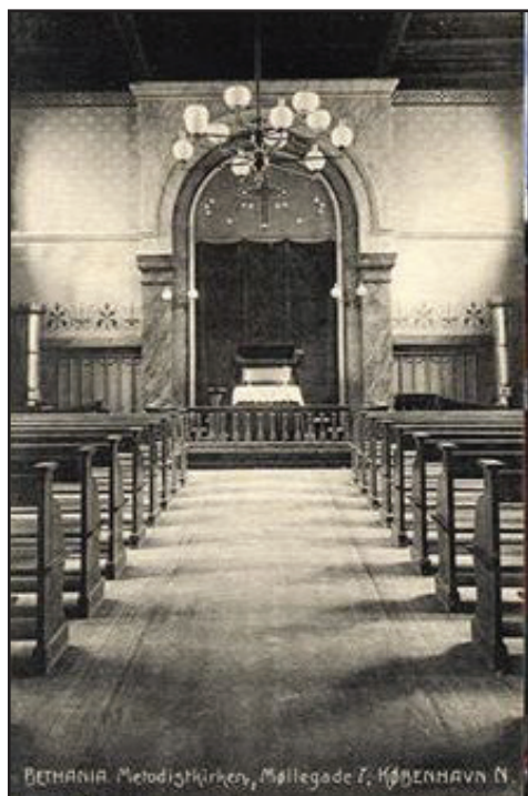
BETHANIA. Metodistkirken, Møllegade 7, KØBENHAVN N

at benytte kirken. Først den 18. april 1893 modtog menigheden endelig bygningsattesten og kunne fra da af bruge kirken. Tilslutningen til menigheden var forholdsvis stor. Til den første gudstjeneste kom der mere end 350 mennesker, og menigheden selv voksede fra 78 medlemmer i 1889 til 209 medlemmer i 1899. Det var en aktiv menighed, hvor man både drev søndagsskole og ungdomsforening - Epworthforeningen. Fra 1920 og frem oprettedes desuden en gymnastik-, afholds- og spejderforening samt en Ydre Mission. Under krigen fungerede kirkens kælder som beskyttelsesrum, hvilket krævede en senere restaurering finansieret af staten. De unge i menig-