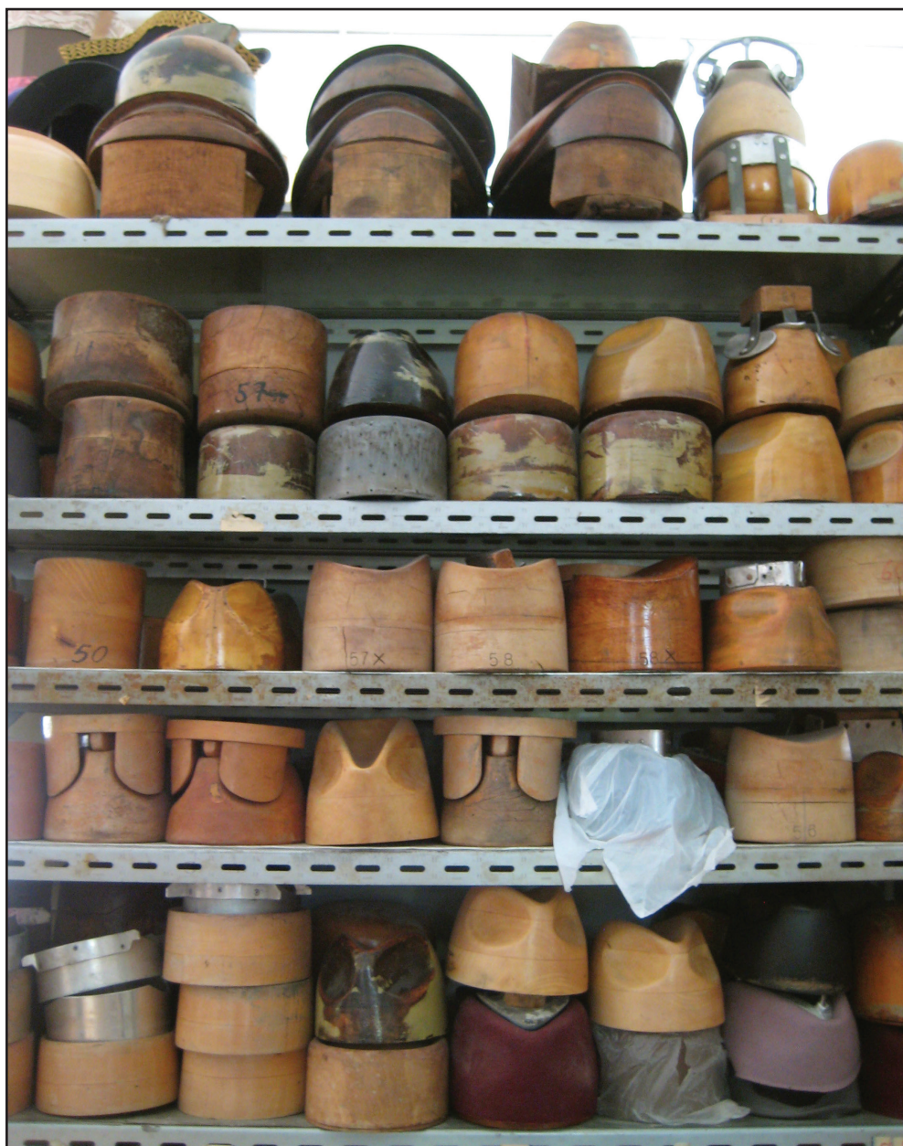
Hattefabrikken har intet mindre end 5.000 hatteforme og de står tæt pakket fra gulv til loft.