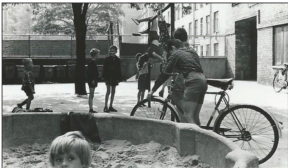
Et kig ind i gården i Lundtoftehus.

Det skyldtes, at min mor kom til at sætte slangen til det forkerte hul, så en masse støv og skidt blæste ud i stuen. Så vidt jeg husker, lykkedes det at støvsuge det meste op igen, men det gad min mor altså ikke være med til længere.