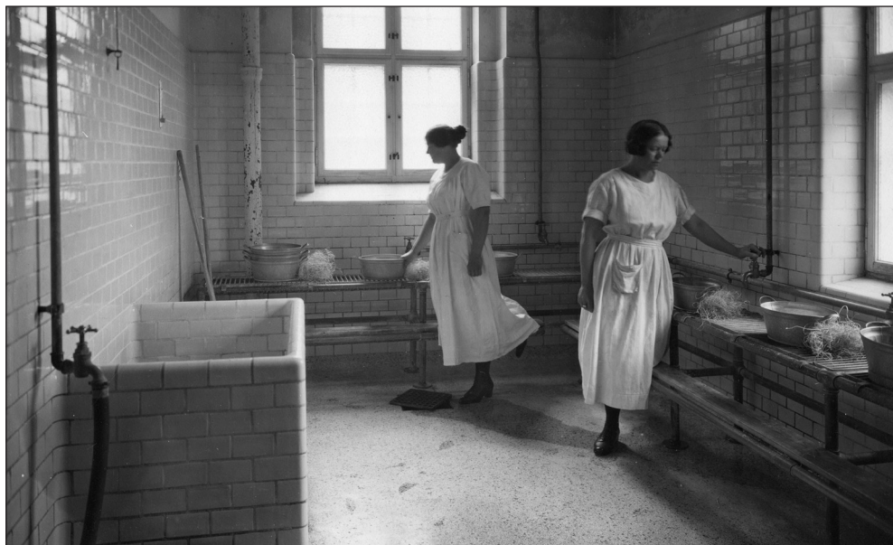
Interiør fra kvindeafdelingen i badeanstalten i Sjællandsgade. (Foto: 1920'erne, Københavns Museum).

Ud over det traditionelle karbad eller brusebad lokkede Sjællandsgadebadet med andre fristelser så som karbad med æteriske olier, bademælk eller salt fra Det døde Hav, saunagus for kvinder, wellness fra top til tå eller massage. Det var ikke uden grund at Sjællandsgadebadet til sit navn havde føjet: Huset med ro