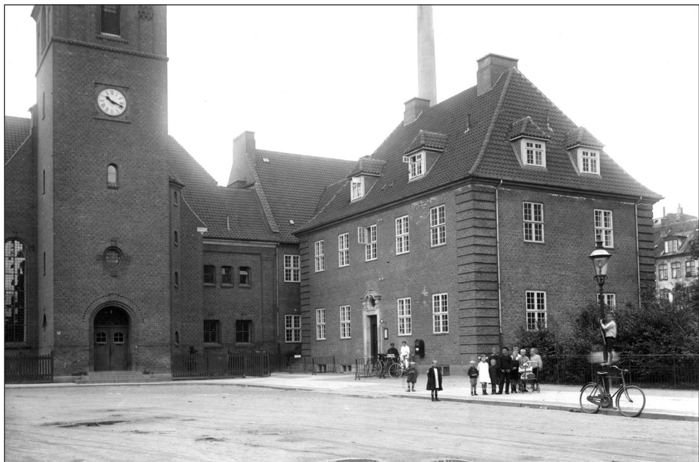
Badeanstalten i Sjællandsgade med Simeonskirken til venstre. (Foto: 1920, Københavns Museum).