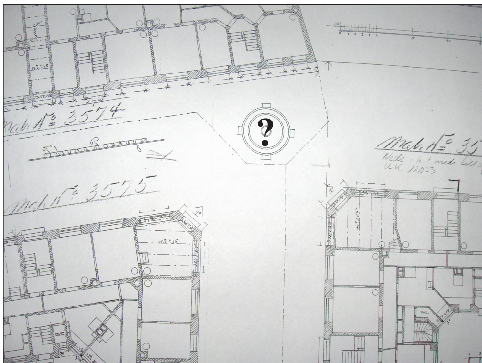
Udsnit af plantegning fra 1903 af Thors Passage. Bemærk rundingen hvor Thor-monumentet muligvis har stået. (Københavns Kommunes Tegningsarkiv).