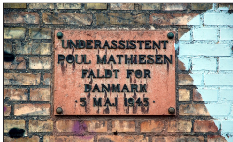
Tavlen i Ragnhildgade.

Fra efteråret 1944 blev han tilknyttet militærgruppen "Kompagni Robert".