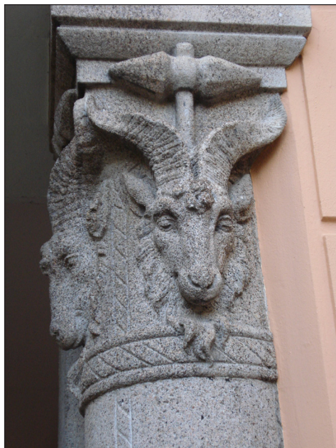
Bukkehovederne øverst på søjlerne ved porten mod Dagmarsgade.