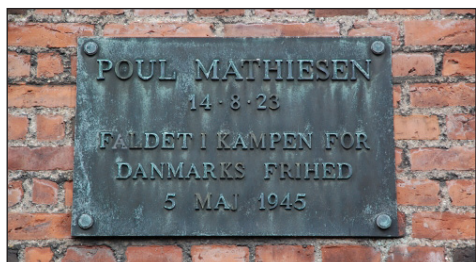
Tavlen i Sjællandsgade.

Den 5. maj 1945 blev kompagniet kommanderet til vagttjeneste ved Frihavnen. Ved middagstid ankom en bil, som ønskede at komme ind til Frihavnen gennem Nordrefrihavnsporten. Da porten var lukket, forsøgte bilen at køre gennem, men den blev stoppet af frihedskæmpere.