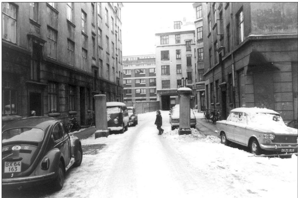
Thors Passage set mod Allersgade engang i 1980'erne. I baggrunden bag de to søjler er pladsen, hvor Thor-monumentet muligvis har stået.