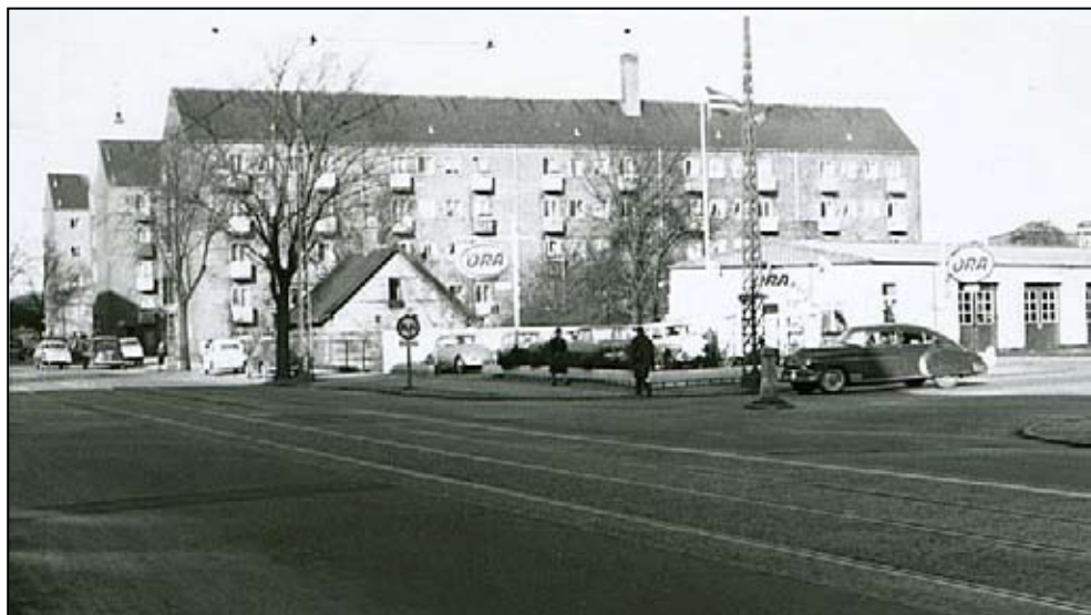
Rovsinggades udmunding i Tagensvej set i retning af Bispebjerg. Foto: FHC, marts 1963.

Mellem Rovsinggade og “De tre Søstre”, på Tagensvej nr.148, lå der helt op i 70'erne, et gammelt, gult murstenshus på den tilhørende, ganske store grund og både hus og have, lå ca.1 meter under gadeniveauet, med 3 - 4 trappetrin ned. Langs fortovet ind mod grunden var der et trådhegn og ved nedgangen var der et ophold, hvor der engang havde været en vinkeljerns låge med trådnet.