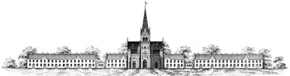
Opstalt mod St Hans Torv .