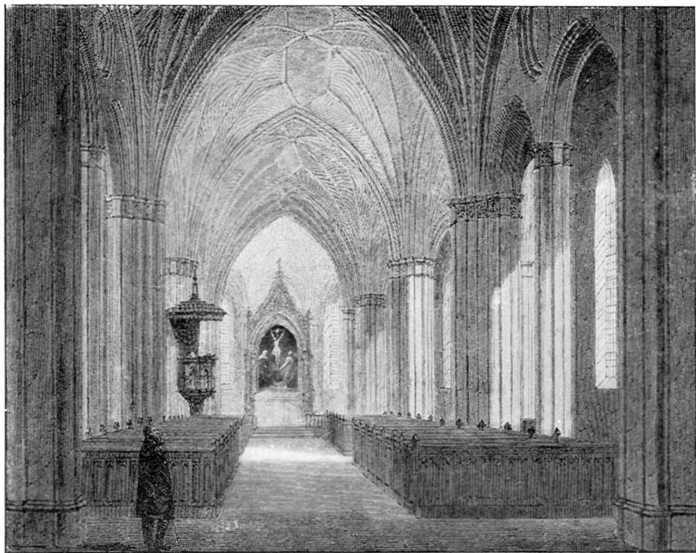
Alteret med "Feilbergs Altertavle". Efter et billede i Illustreret Tidende nr. 56 fra 21. oktober 1860.

forestiller Kristi Himmelfart. Det er malet af historiemaleren J. L. G. Lund. Gennem kirkens historie er billedet beskrevet som det, der blev malet omkring 1817 i Rom. I efteråret 1818 blev det sendt hjem til Danmark med det formål, at det skulle være alterbillede i Christiansborgs slotskirke. Men det passede ikke til dette kirkerum og blev derfor tiltænkt som alterudsmykning i Vor Frue Kirke. Også denne plan blev opgivet, da Thorvaldsens Jesusfigur samt de 12 apostle blev udsmykningen af den nyopførte