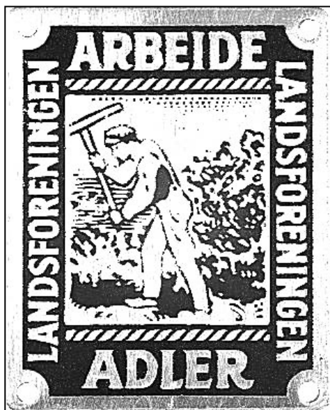
Arbejde Adlers bomærke - manden med hakken - tegnet af Joakim Skovgaard.

sociale samliv; i et par dage kunne man få kost og logi mod noget praktisk arbejde. Målet var at fremme ædrueligheden og animere til en normal arbejdstilværelse. Forskellen på arbejdskolonierne og herbergerne var, at man i arbejdskolonierne kunne blive i en længere periode, hvorimod man på herbergerne kun kunne overnatte en enkelt eller to nætter. Man overnattede i store sovesale på herbergerne, mens man på kolonierne havde enkeltværelser.