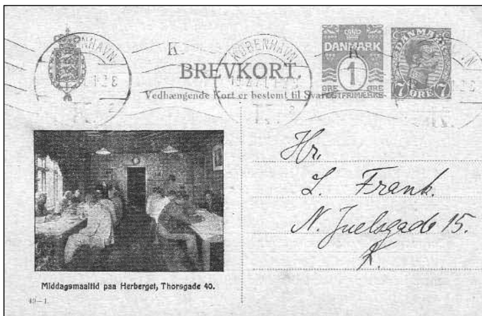
Postkort fra 1920'erne med motiv fra Arbejde Adlers herberg, Thorsgade 40.