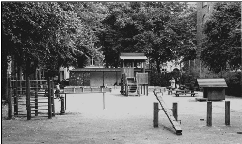
Legepladsen i Baldersgade set mod nord. Bag læskuret ses huse på Balders Plads. Foto fra 1970'erne.

undersøgelleslokale var matterede for at skærme af mod nysgerrige blikke.