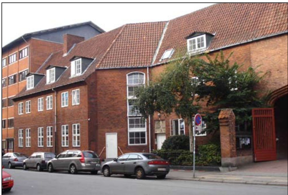
Arbejde Adlers herberg i Thorsgade blev opført i 1934. I dag ligger værestedet "Oasen" i samme bygning.

for Fix-Karreen. Allerede fra 1973 benyttede den færøske menighed Samuels Kirke til gudstjenester.