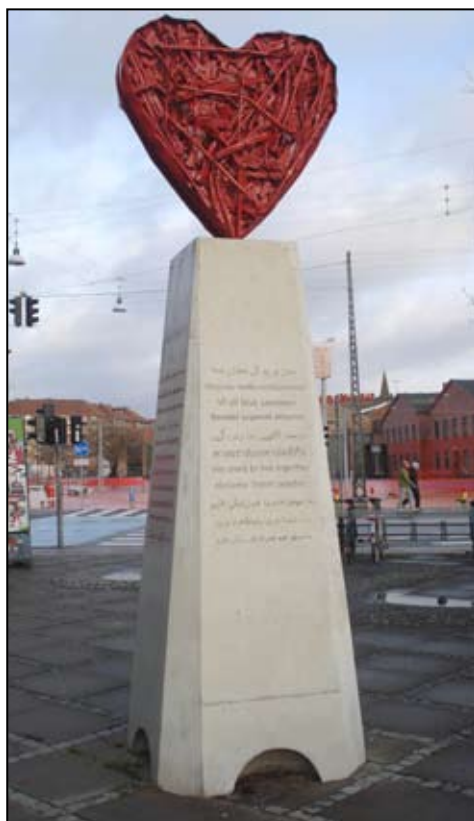
Monumentet 'Nørrebros Hjerte' på Aksel Larsens Plads består af et 135 cm. højt og rødakeret hjerte på en 3 m. høj betonsokkel. På soklens fire sider står der "Vi vil leve sammen" på 11 sprog (arabisk, dansk, engelsk, farsi, kurdisk, persisk, serbokroatisk, somali, thai, tyrkisk, urdu).

I 2008 blev beboerinitiativet 'Vi vil bo her sammen – alle sammen!' stiftet på Nørrebro som en reaktion på en række skudepisoder med baggrund i rocker- og bandemiljøet i København og på Nørrebro. Dagen efter en voldshandling mødtes gruppen kl. 17 på gerningsstedet for at genindtage byens rum. Initiativgruppen skriver om baggrunden: "Nørrebro er