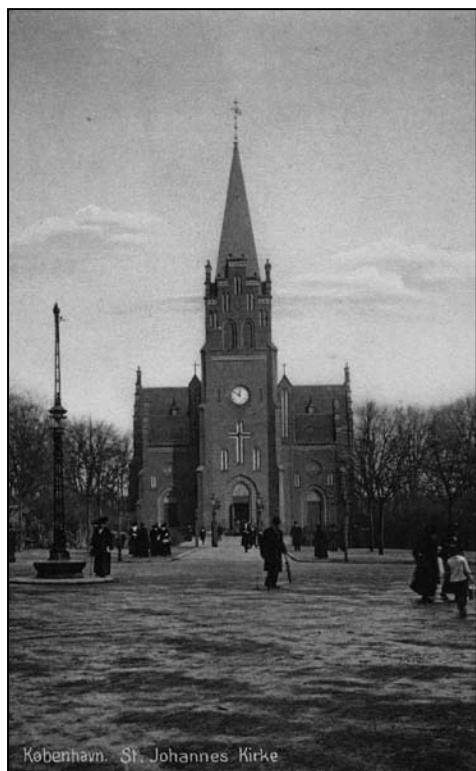
København. St. Johannes Kirke