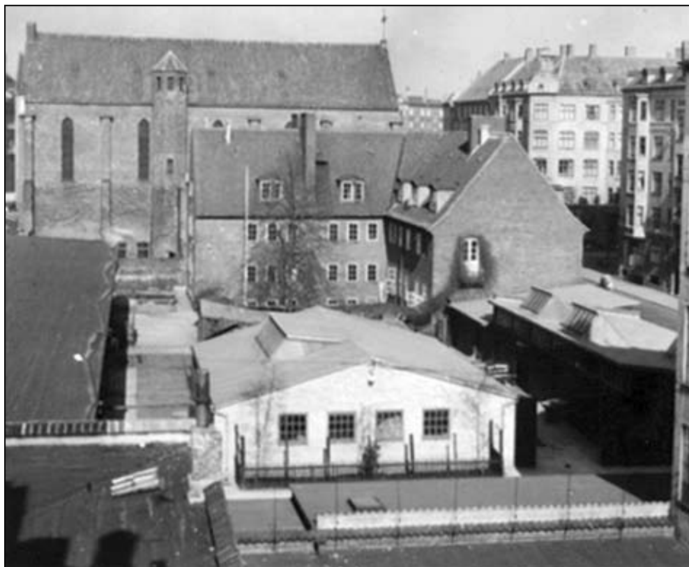
Udsigt over Arbejde Adlers bygning i 1950'erne. Den høje bygning i baggrunden er Samuels Kirke.

var nu lykkelige for at kunne rejse eget hjem på egen grund. En landsindsamling havde givet så mange penge, at der blev ydet et beløb på 50.000 kr. til paviljonen, som blev indviet den 30. august 1925. Her havde Nørrebro KFUM deres virke helt frem til den 12. juli 1937, hvor ejendomsselskabet "Ørnen" fik tilskødet matriklen. Her blev den endnu eksisterende gule murstensejendom opført og taget i brug fra 1939-40.