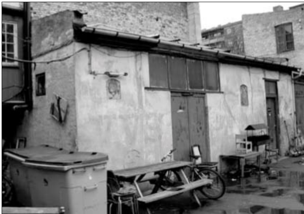
Atelieret i Rådmandsgade 34 som det ser ud i dag.