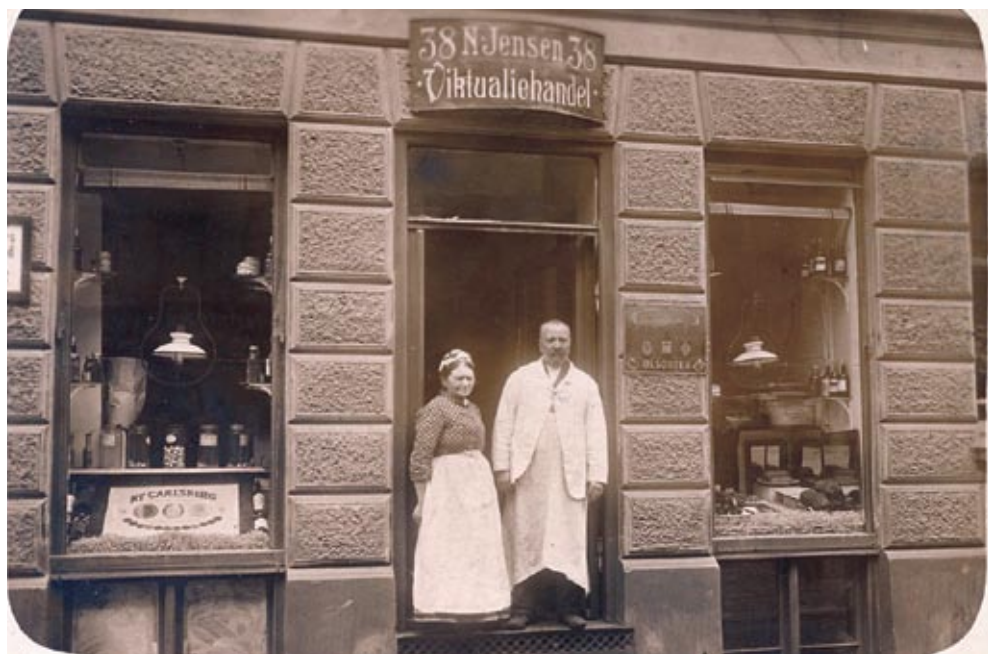
N. Jensens viktualiehandel i Griffenfeldsgade 38, ca. 1915.