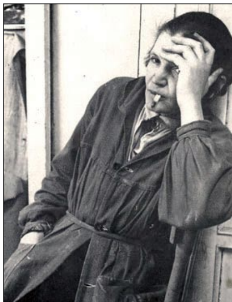
Astrid Noack i tiden under Anden Verdenskrig.