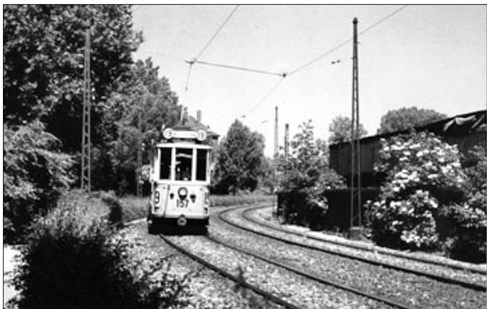
Linie 19 på sin vej over "Prærien" mellem Nordre Fasanvej og Borups Allé, billedet er fra slutningen af 1950'erne.

hed sig at parken var lukket. Ellers tog vi ned til åen. Vi gik op til Hille-rødgade og videre ad denne, forbi Falckstationen, og når vi kom til nogle sporvognskinner drejede vi til venstre og kom så ned i et lille anlæg. Her kørte linie 19 på et areal for sig selv, og skinnerne lignede togskin-ner, og sporvognen kørte altid som enkeltvogn, så denne var blevet døbt prærievognen. Her kunne vi få meget tid til at gå. En dag fandt vi en død kat, og den tog vi med hened og begravede den. Nogle dage efter gik vi ned og skulle se til katten, og begyndte at grave den op. Da vi havde gravet no-get, kunne vi se, at der var helt levende