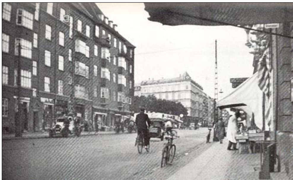
Jagtvej med hjørnet af Hørsholmsgade i baggrunden engang i 1950'erne.