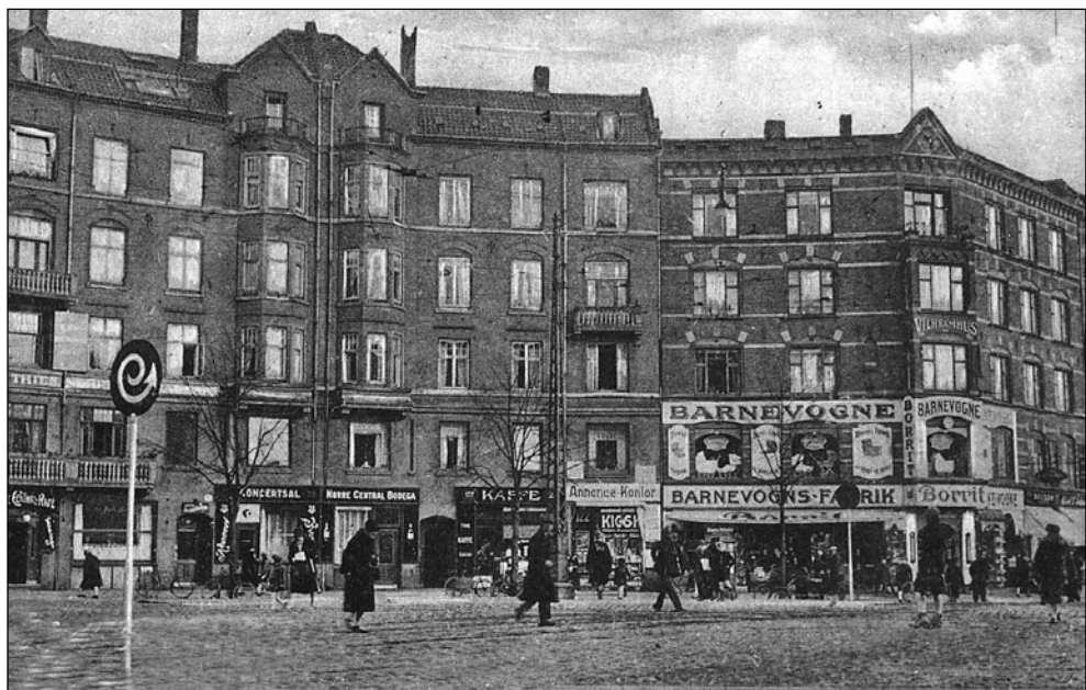
Nørrebro Runddel med barnevognsforretningen Borrit på hjørnet. Butikken havde også en afdeling med legetøj. Ældre postkortfoto.

kælderlokale på Jagtvejen nr. 35. Her købte vi hinkesten, farvede lerkugler, bolde osv. Man kunne også købe knaldhætter i rulle, men dem jeg skulle bruge var små skiver med seks skud, og dem havde de ikke der, og heller ikke hos Borrit på Nørrebro Runddel. Jeg måtte helt ned på Nørrebrogade nr. 74. På vejen derned var der forretninger hele vejen.