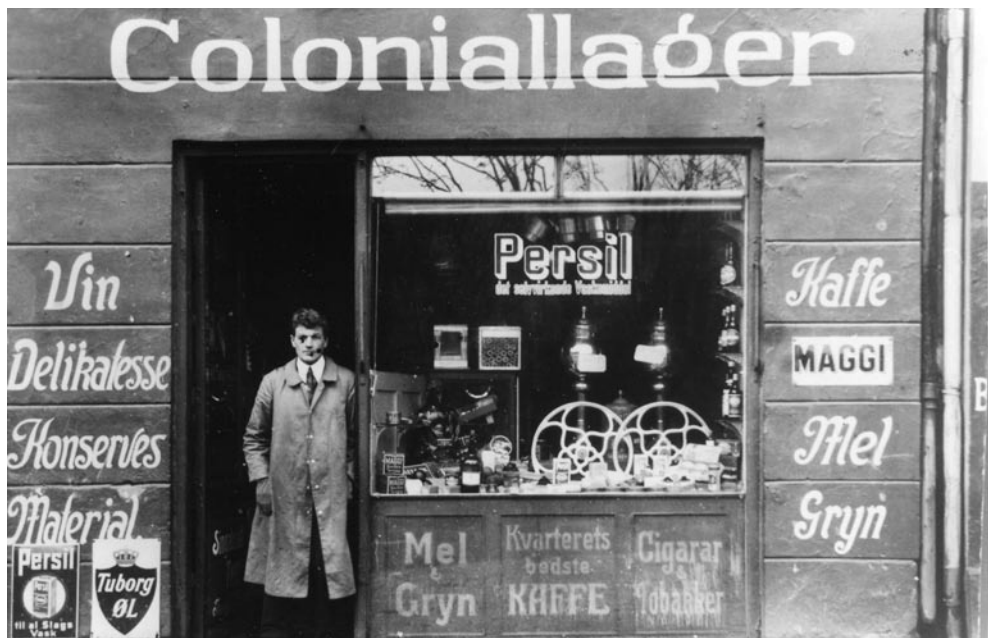
Coloniallageret i Rådmandsgade annoncerede med kvarterets bedste kaffe.