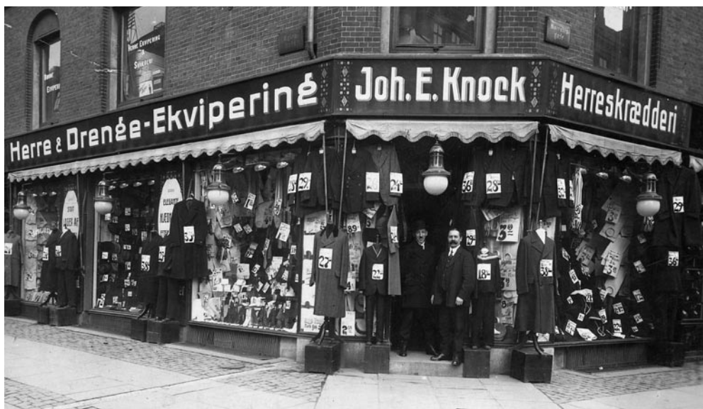
Herreekviperingsforretning på hjørnet af Ægirsgade og Nørrebrogade, ca. 1915.