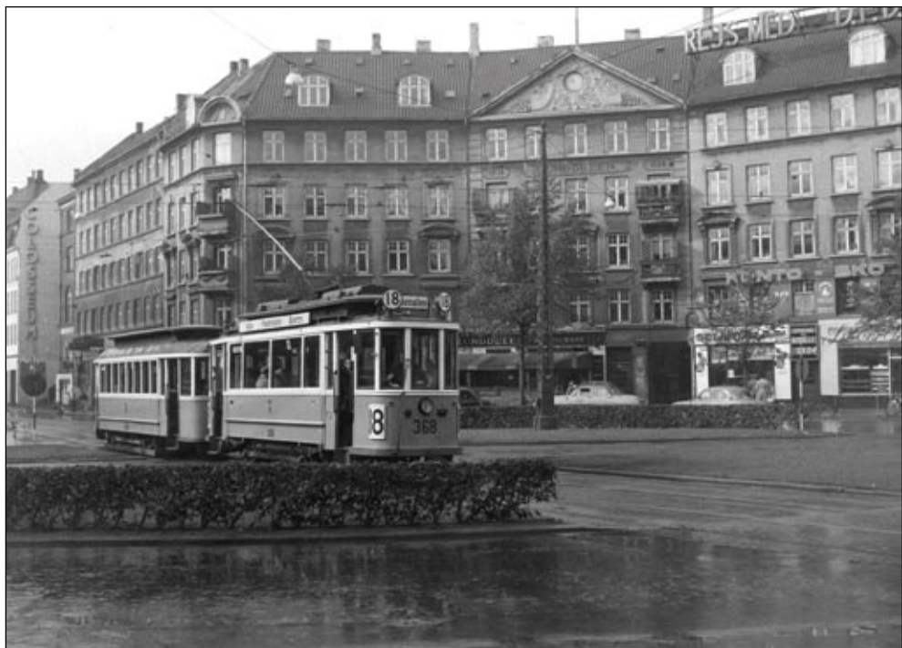
Nørrebros Runddel set mod Jagtvej med linie 18 på vej mod Østerbro. Foto fra 1950'erne.

til Nørrebros Runddel og tog linie 5,7 eller 16 og kørte ind mod byen. Vi stod altid på foran ved vognstyreren. Her var oplevelsen størst, med rigt udsyn over gaden til begge sider. Det var også spændende at se vognstyreren dreje på de to håndsving for at få sporgvognen til at køre og bremse. For det meste stod han op, men der var et sæde på en søjle, som kunne drejes fremad og til siden, så nogle gange sad han på dette sæde. Han havde da den højre fod hvilende på et brædt, der sad på skrå, og når der kom noget trafik i vejen, lod han foden dumpe ned på en stor