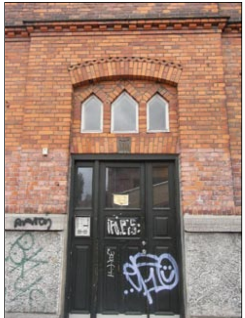
Indgangsdør i Bragesgade.

Fortsætter man mod Hamletsgade kan man se fire forskellige moderne fortolkninger af mursten. Nr. 15-23 er i røde mursten, jævnt og gedigent, dog med en nydelig fremhævelse af portens bue. Bygningen er opført i 1949, og kan ses som et udslag af Danish Design, hvor praktisk enkelhed og gode råvarer var i højsædet. Overfor finder man også røde mursten i nr. 12-16, dog kun i et enkelt lag, nemlig