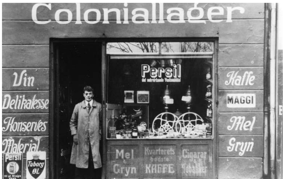
Kolonialforretningen i Rådmandsgade reklamerede med "kvarterets bedste kaffe". Foto ca. 1915.