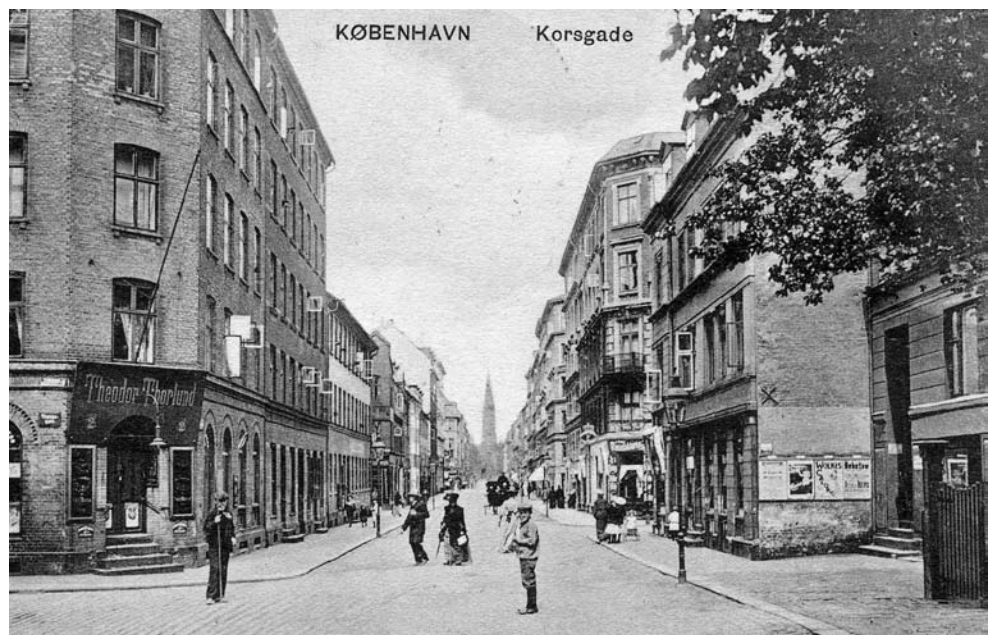
Korskade ved Ewaldsgade, ca. 1910. I baggrunden ses Hellig Kors Kirkes spir. Store dele af det tætte kvarter blev saneret i 1980'erne.