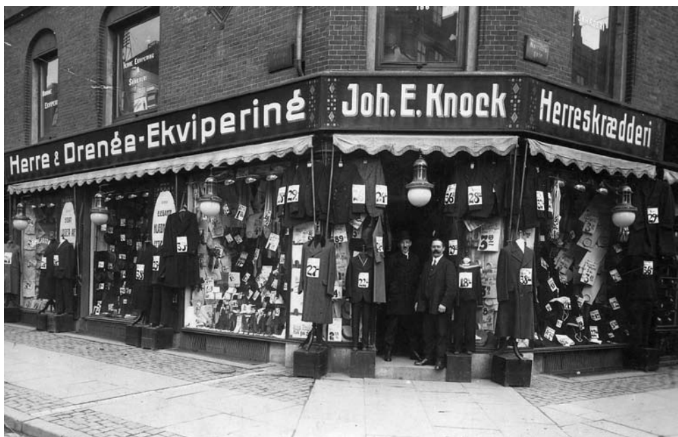
Hjørnet af Nørrebrogade og Ægirsgade, 1915. Johannes E. Knock's Herre- og Drengs-Ekvipering kunne blandt andet tilbyde et sæt matrostøj til 18 kr., en herrefrakke kostede 38 kr., et halstørklæde kunne fås for 1,32 kr. og en herreskjorte kostede 3,89 kr.