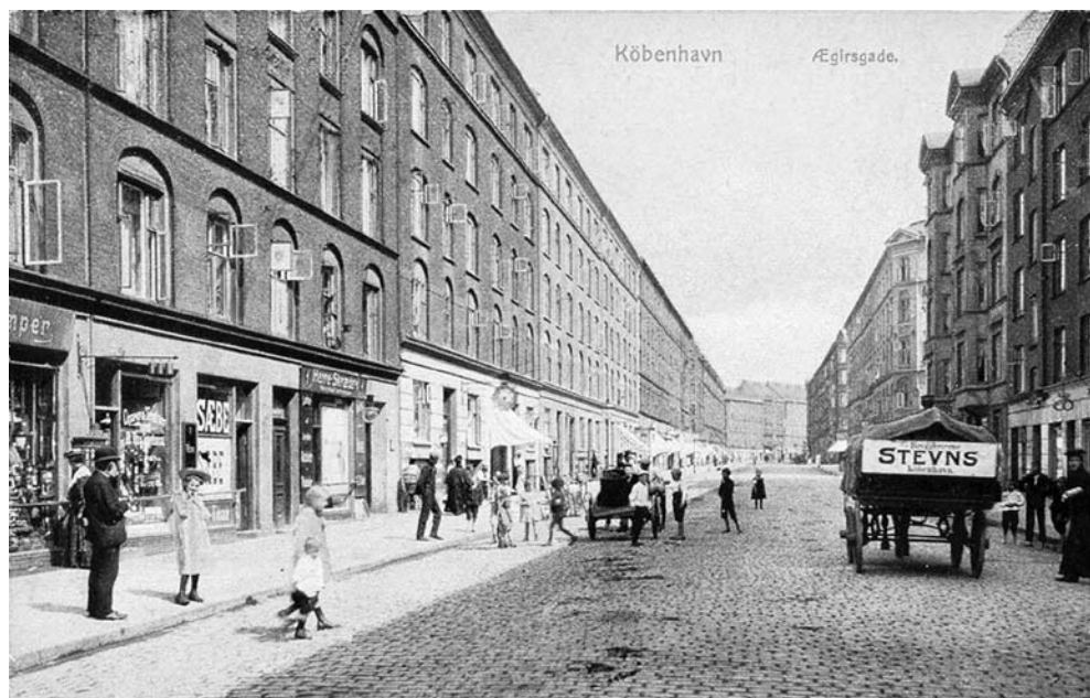
Ægirsgade set fra Nørrebrogade. Postkort fra omkring begyndelsen af 1900-tallet.

Men jeg begyndte at drømme mig tilbage til min barndom som i stor udstrækning netop foregik i den del af Ægirsgade, som er vist på kortet.