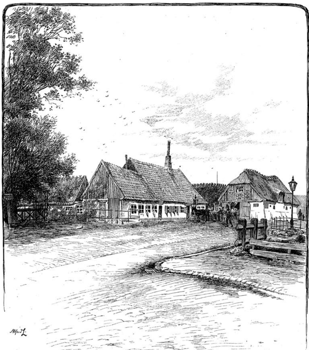
Den gamle Lygtekro, der lå hvor Nørrebrogade krydsede Lygteåen. (Tegning af Alfred Larsen ca. 1890. Efter "Gamle københavnske Huse og Gaarde", 1894).