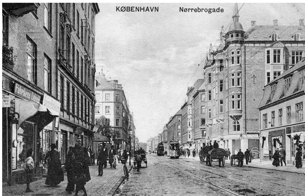
Dagligliv på Nørrebrogade, som det tog sig ud omkring 1905. Ejendommene er stort set de samme som i dag, men trafikken er en anden.

Afsked med den ved et Glas. En Del af Haandværkerne, som arbejder paa Nybygningerne i Nabolaget, er i de senere Aar kommet til, og det kan jo være, at de bringer Omvæltningstanker ind i den gamle Lygte, saaledes at ogsaa den faar i Sinde at lyse i en ny og bedre Skikkelse. Foreløbig staar den der imidlertid som Fortidens Repræsentant.