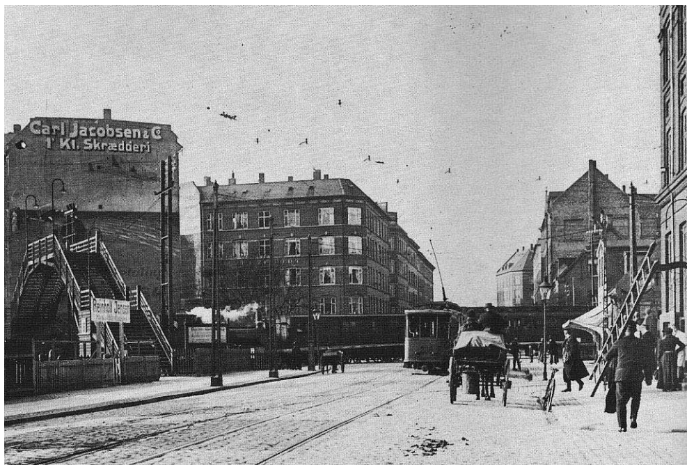
Jernbaneoverskæringen på Nørrebrogade ved Bragesgade, 1913.