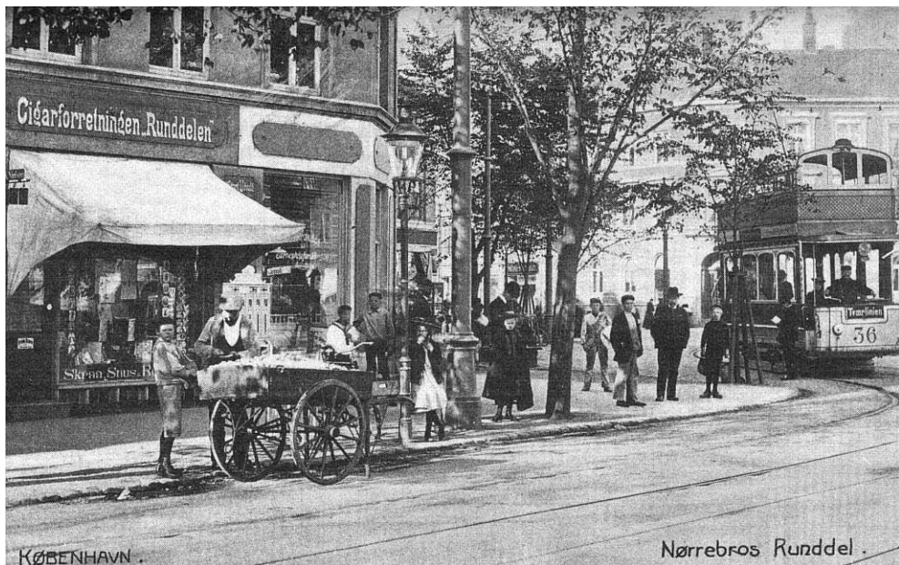
Hjørnet af Jagtvej og Nørrebro Runddel omkring 1905. Sporvognen fra "Tværllinien" vendte her og returnerede til Frederiksberg Runddel.