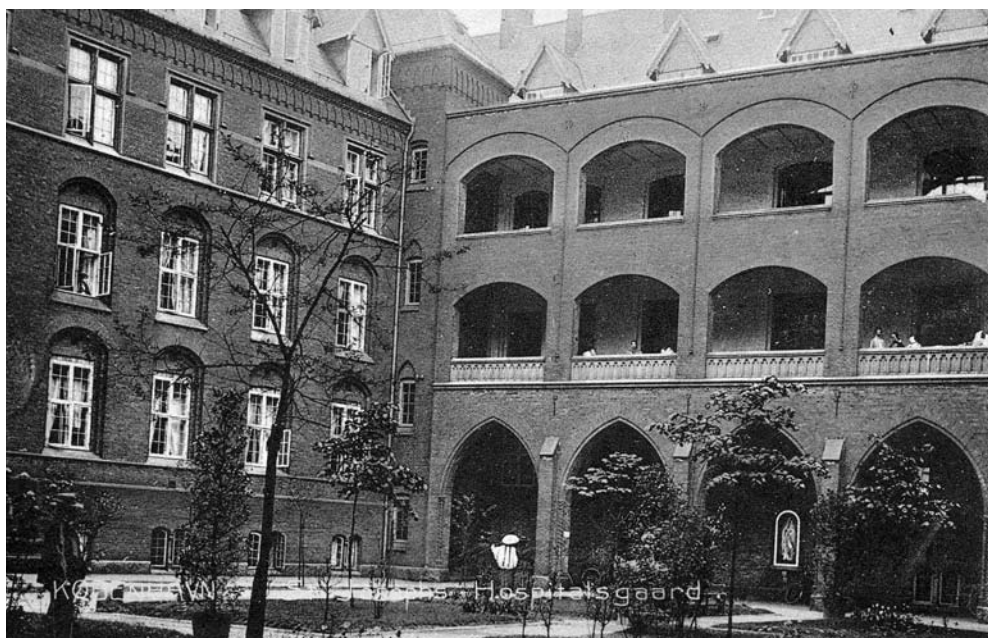
Gården til Skt. Josephs Hospital med buegange og haveanlæg, ca. 1905.

enkelte søster forblev ”usynlig”, idet formålet var at skulle virke på samme måde som Den Hellige Joseph, der drog omsorg for Jomfru Maria og Jesus uden tanke på sig selv. Derfor fik ordenen navnet Sankt Joseph Søstre.