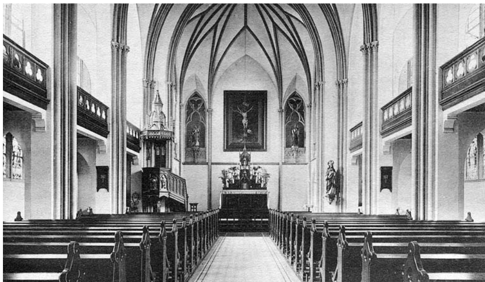
Kirkesalen i Skt. Josephs Hospital ca. 1905. Efter at hospitalet var blevet nedlagt blev den ombygget til festsal.

I 1900 opførte man en tilbygning med tilhørende kirke, og i 1904 opførtes et midterparti, som forbandt ”det gamle” og ”det nye” hospital, således at der nu var 500 sengepladser fordelt på 122 sygestuer.