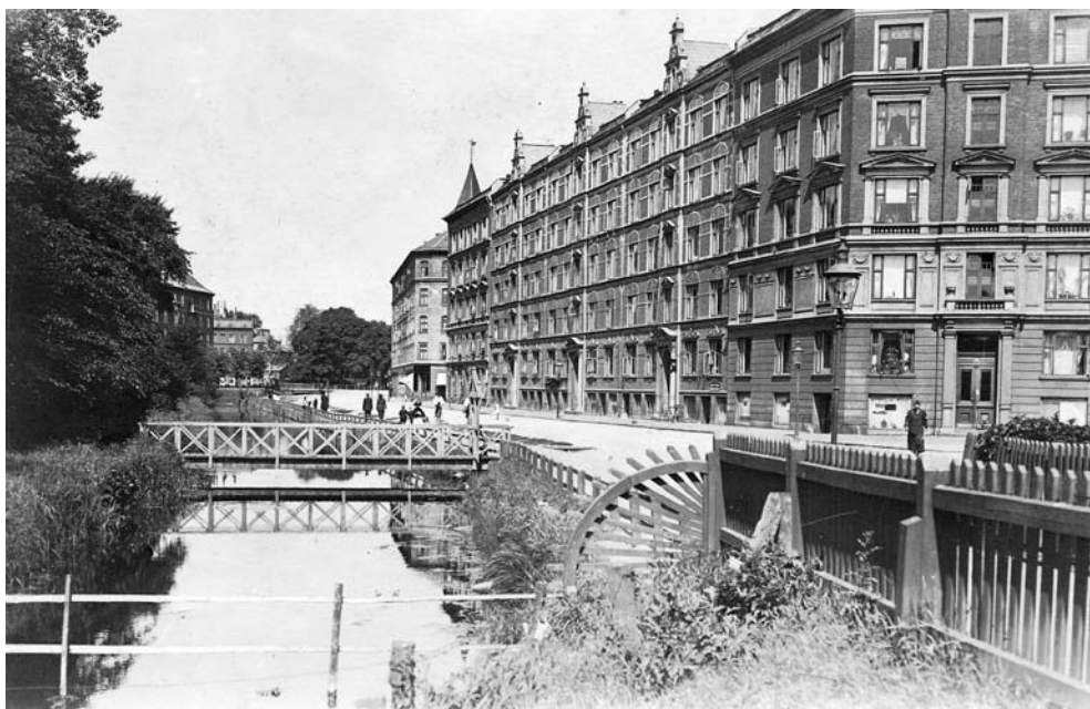
Idyl ved Ågade omkring 1910. Træerne til venstre og ejendommene er de samme i dag, men siden er åen blevet rørlagt og Ågade blevet til en 6-sporet motorgade.