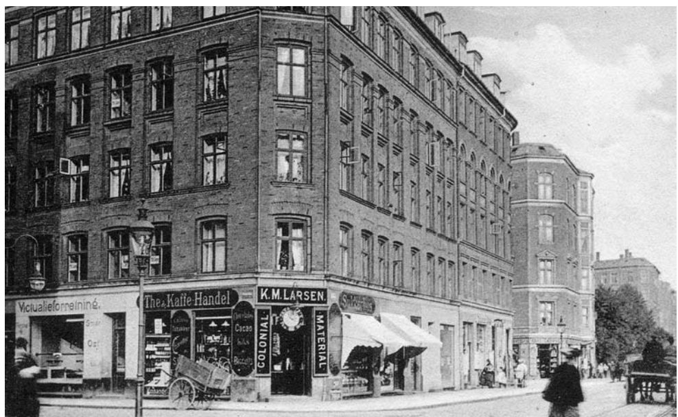
Hjørnet af Åboulevarden og Fiskergade, ca. 1910.